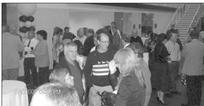
Arrivée des invités dans le grand hall d'entrée.